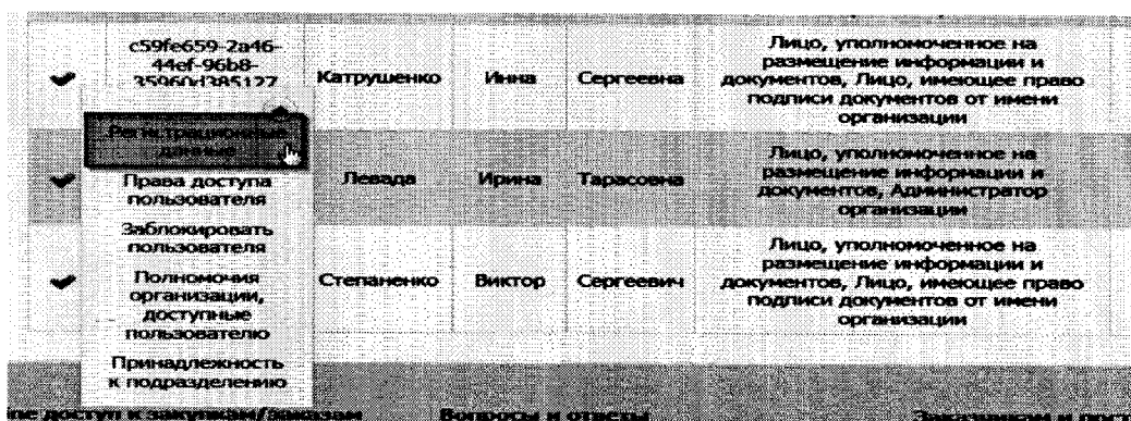
Рис. 3. Отображение выпадающего меню «Регистрационные данные».

Пользователю с полномочием «Руководитель» или «Администратор организации» необходимо в столбце «Логин» пользователя зайти в пункт выпадающего меню - «Регистрационные данные» (Рис.3).